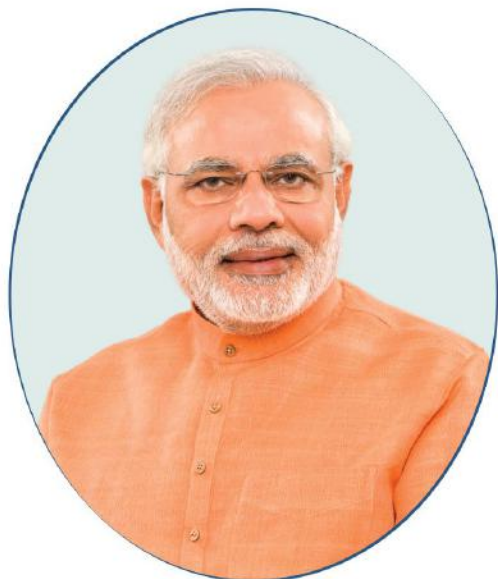
श्री नरेन्द्र मोदी प्रधानमंत्री