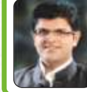
श्री दुष्यंत चौटाला उप मुख्यमंत्री